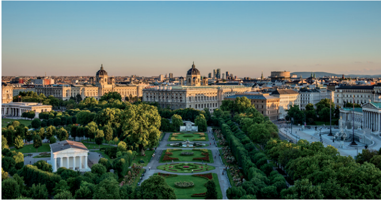
Prunkvolles Wien: in der Bildmitte das Kunsthistori- sche Museum